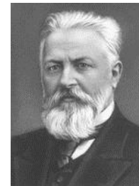
МИХАИЛ ОЛЬМИНСКИЙ 1863-1933

Теперь оценим и сравним объективные и субъективные условия для развития классовой борьбы пролетариата в современной буржуазной России.