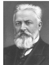
МИХАИЛ ОЛЬМИНСКИЙ 1863-1933

Теперь оценим и сравним объективные и субъективные условия для развития классовой борьбы пролетариата в современной буржуазной России.